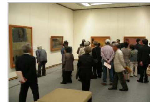
「生誕100年・香月泰男と下関～旅のはじまり～」